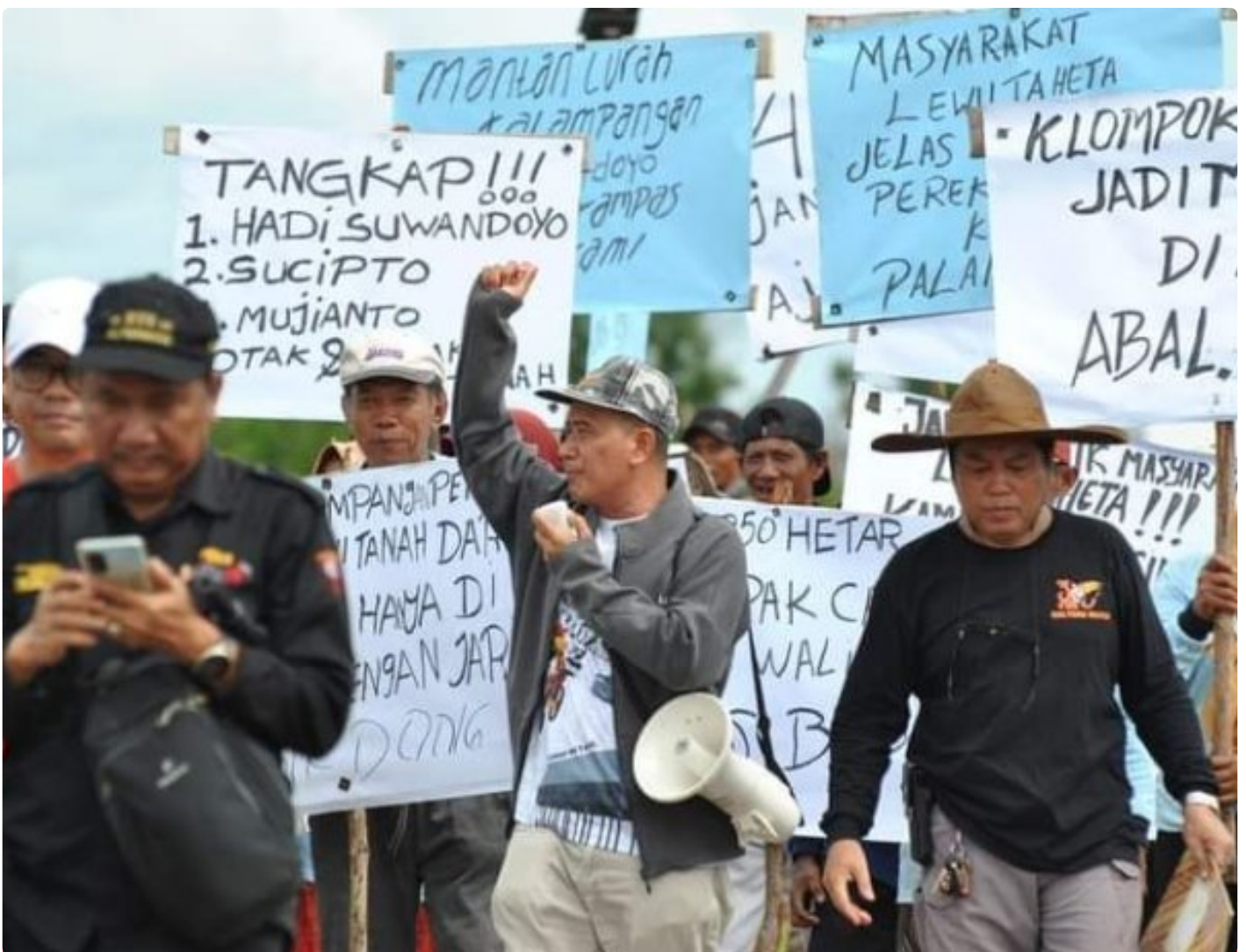
Gambar: Aksi Unjuk Rasa Masyarakat Kelompok Tani "Lewu Taheta"

PALANGKA RAYA - Sengketa kepemilikan tanah yang terjadi di Kota Palangka